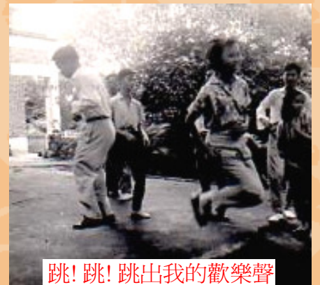
跳! 跳! 跳出我的歡樂聲