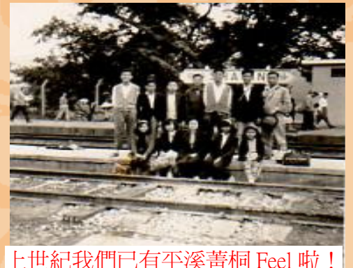
上世紀我們已有平溪菁桐 Feel 啦!