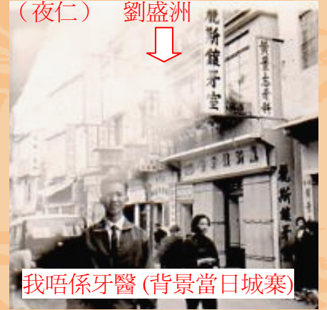
我唔係牙醫 (背景當日城寨)