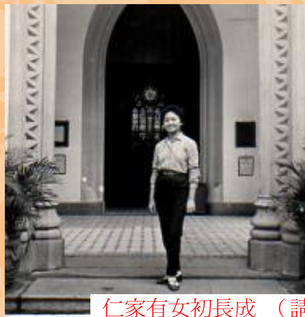
仁家有女初長成 (請留意標準的丁字腳)