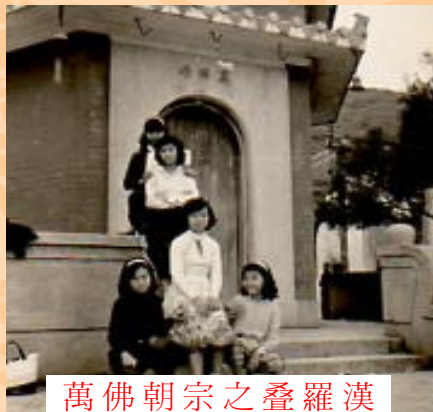
萬佛朝宗之疊羅漢