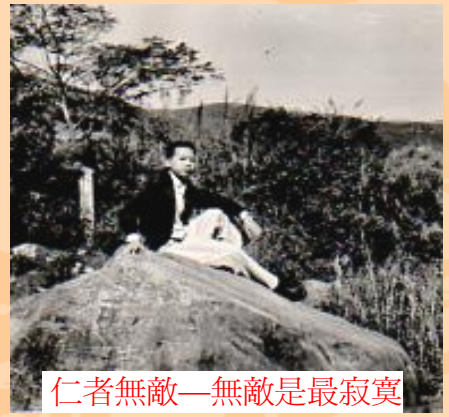
仁者無敵—無敵是最寂寞