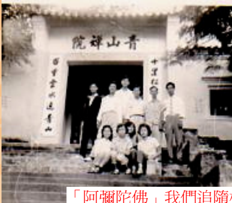
「阿彌陀佛」我們追隨杯渡禪師去也!