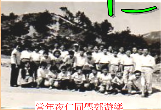
當年夜仁同學郊遊樂