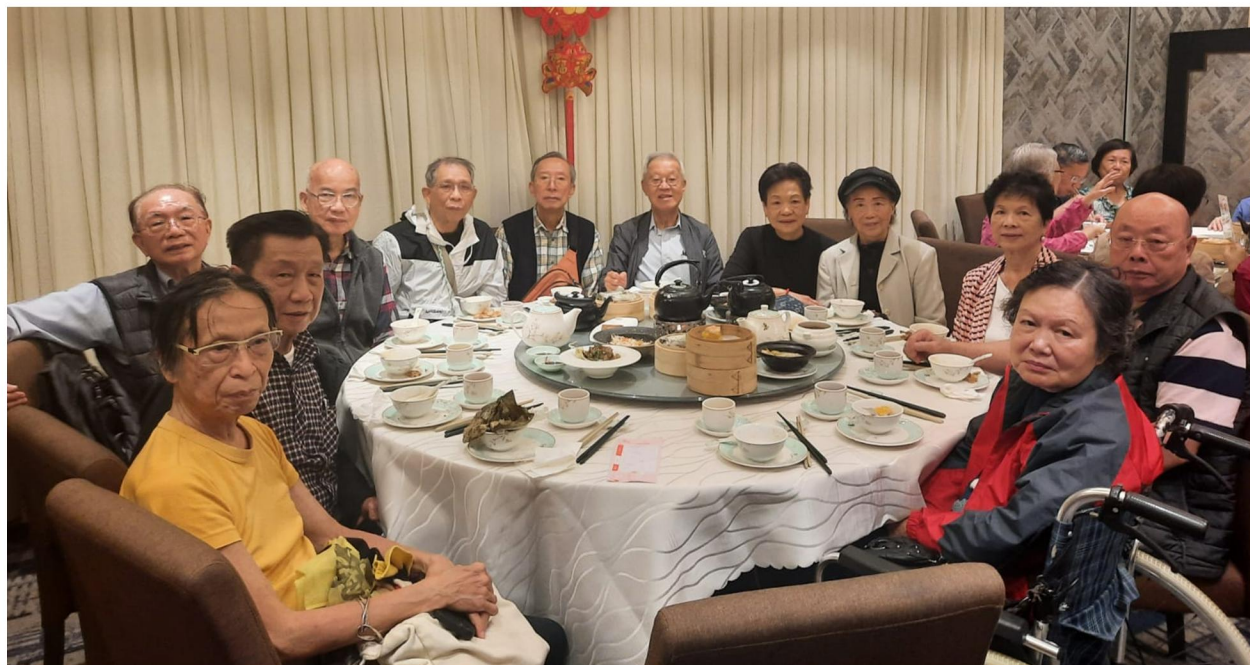
Feb. 22, 2024 「溫哥華, 忠社」, 在列治文, 金濤酒家, 舉行新春茶敘。