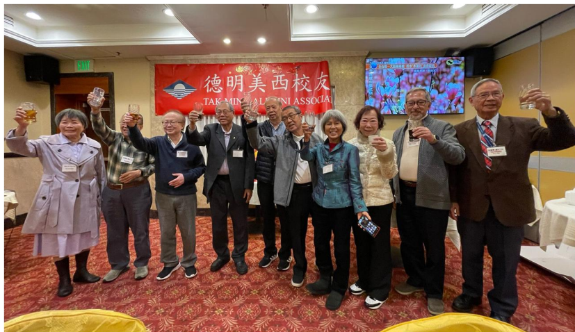
美西校友會春宴(洛杉磯)