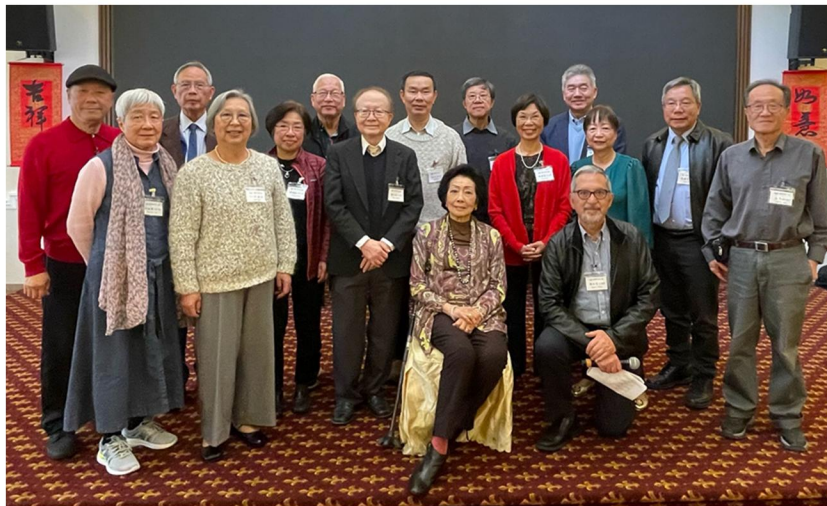
美西校友會春宴(三藩市)