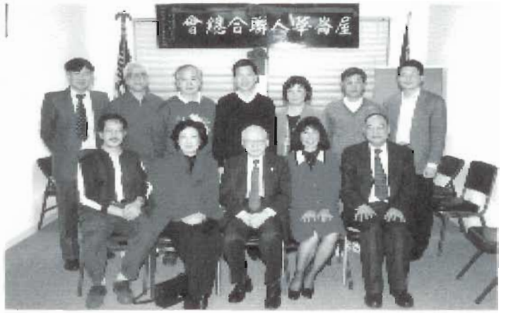
當選理事會部分成員