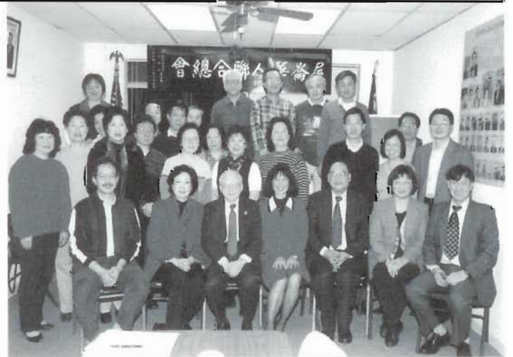
出席選舉大會全體校友

通訊是聯繫各位校友的媒介，內容除了報導會務，預告節目，希望寫出大家關心的事物。「人物專訪」每期介紹一位人物，今期我們至感榮幸得到陳校長接受訪問和慨贈墨寶，更高興者謝主任不吝珠玉，千里賜稿，學長胡武題字，多位理事揮筆寫稿。但仍嫌不足，請各方校友撰寫感性文章，提供近況消息和寶貴意見。「屬會點滴」、「會友訊息」、「雅文共賞」、「活動花絮」和「真知灼見」等園地公開，誠邀大家供稿。《德明校友通訊》與你息息相關，請多多支持和運用。