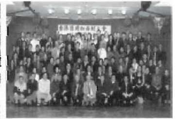
加西校友會新春聯歡合照

光陰流逝，世事變幻。不管世局如何，德明校友會通訊如期與大家見面。準確而全面地報導校友的訊息與連場的活動。