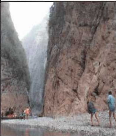
人力拖船滑過小三峽

第九天，早上我們一行人乘小舟到神農溪。由於小溪水淺，祇能用人力拉船渡過。一路上六個人費盡氣力在拉。因為同是中國人，看見他們的辛勞，所以我們坐得一點也不舒服。不過，他們則說，與其一個人受苦，好過一家人挨餓。想想也是道理。下午時份，巫峽在望，神女峰也在眼前。兩小時後，已到最險峻的瞿塘峽了。此峽水道狹窄，畢直崇高的雙岸，急速的江水。三峽大壩建成後，便會成為後人永遠的回憶。劉備托孤的白帝城過了之後，已是夜色迷濛，亦結束了充滿愁思的三峽之旅。