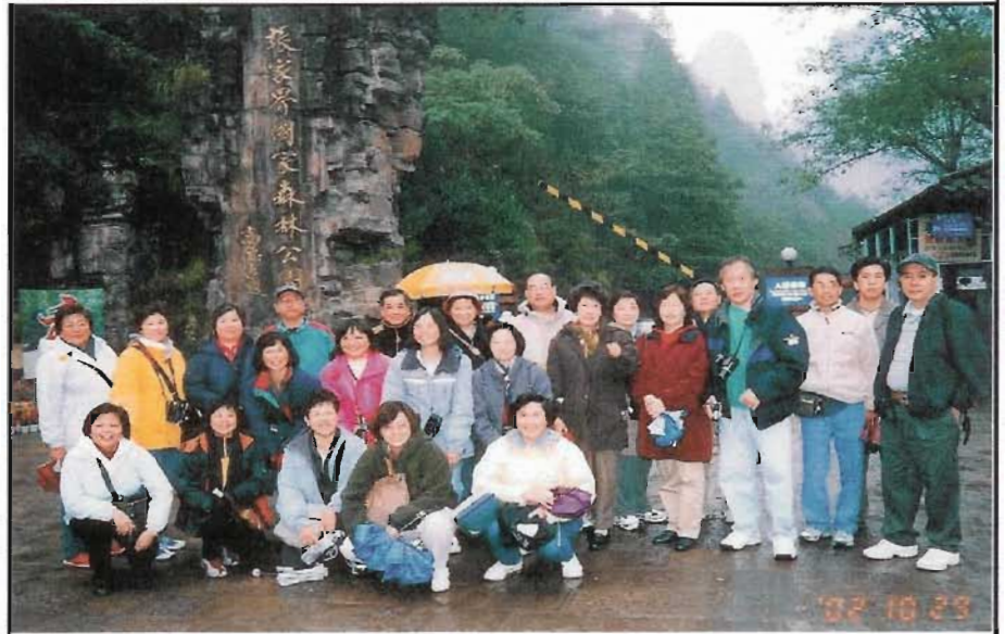
張家界國家森林公園

黃龍洞，讓我們體會到大自然的鬼斧神工，一點一滴的小水珠，經過了千萬年的歲月，刻出了巨大岩洞中那無數不同型態的美麗圖像。從五千多級的石階，可知黃龍洞內的高深和闊大，真的是絕世奇觀。