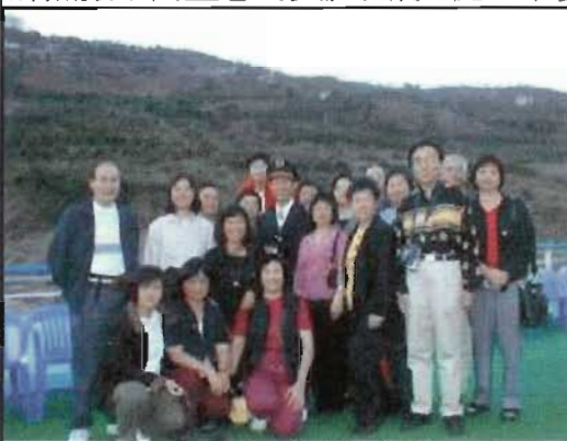
長江三峽遊輪甲板上

第五天，飛機班次取消了，我們被迫改乘火車到枝江，再搭旅遊車直奔武漢。途經三國時代名城荊州，祇見城牆依舊，但已失去當日那一夫當關，百夫莫敵的險要戰略地位。