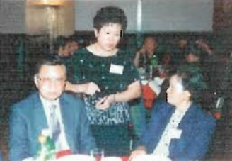
小玉姐升級做侍應生