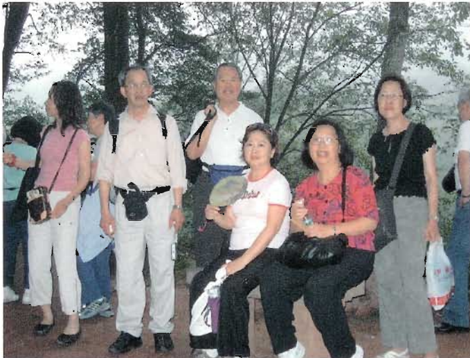
峨 嵋 山 徑

幾經艱辛才爬(走)了一半的山路，路經清音閣的牛心亭，黑(源自黑龍潭)白(源自白水寺)二水千古不斷沖擊牛心石的激流，水珠翻飛，水聲激昂。可惜我們當時不知道這便是有名的「雙橋清音」景區，只有少數校友在此拍照留念。