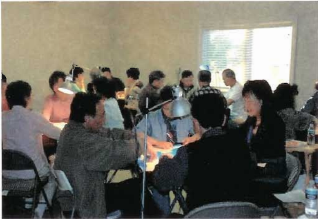
雀林高手暗無天日的連宵血戰

比賽分三場進行，每場兩小時卅分鐘，在這指定的時間中產生了當場的最高分數。而冠亞季軍便是集三場比賽的總分數去排次序。