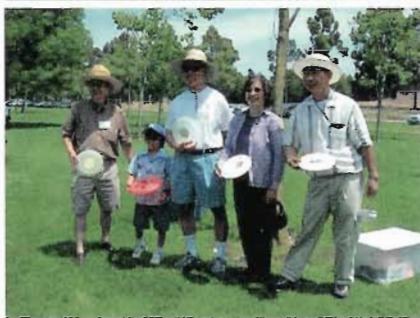
美西德明校友會出版