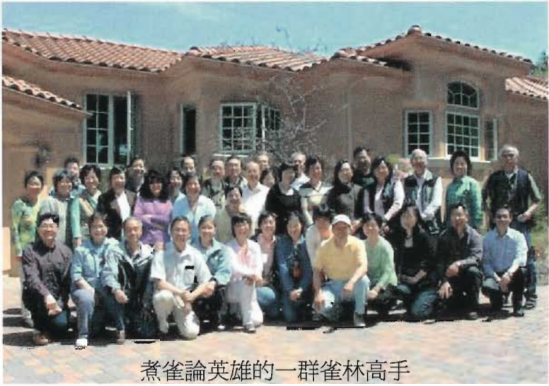
煮雀論英雄的一群雀林高手

在風和日麗的五月五日中午，超過四十位雀林高手齊集於羅士吉圖山崗進行了第一次的麻將高手大比拚。大部份的校友在午時前已準時到達，只有一位校友可能事忙而缺席。首先進行抽籤儀式以決定出場的名次與檯數以保證夫婦不會同檯出現的現象。