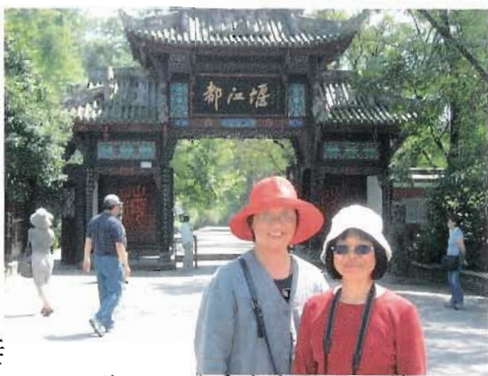
義社甄碧秀與勤社雷秋轉

我們在此參觀、拍照之餘，更緬懷先賢先哲有利民生的智慧。帶著愉快的心情，告別都江堰，告別四川下午飛往昆明。(待續)