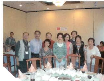
仁社畢業四十週年重聚三