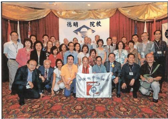
香港校友會代表團