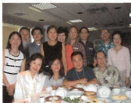
仁社畢業四十週年重聚一