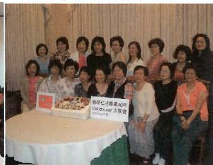
仁社畢業四十週年重聚四