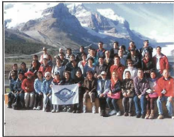
德明友情冰山也溶化