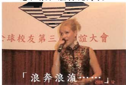
「浪奔浪流……」 - 洋女大唱「上海灘」