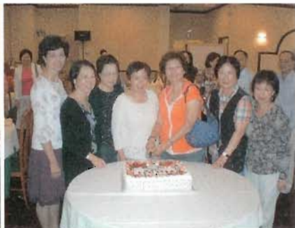
仁社畢業四十週年重聚六