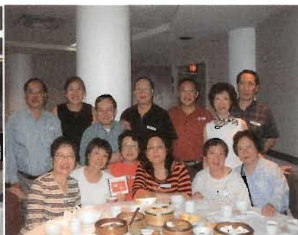
仁社畢業四十週年重聚二