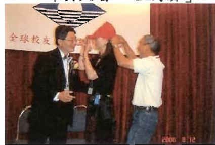
美西康樂理事的話劇表演