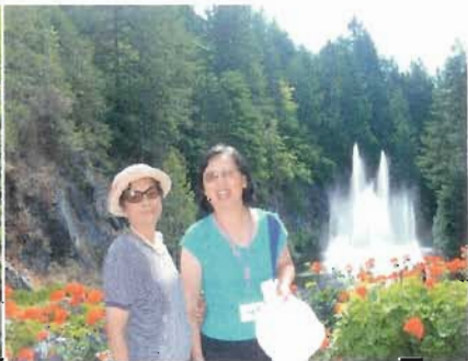
巧奪天工的羅斯噴泉