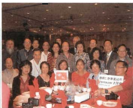
仁社同學在第三屆聯誼大會