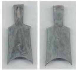
圖 1 為武字空首布