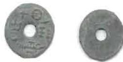
圖 8 為一珠重一兩十四圓錢