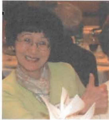
喜 上 眉 梢