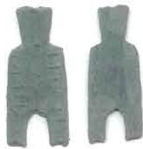
圖 7 為安邑一釵布