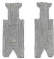
圖 5 為公字銳角布