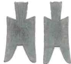
圖 6 為榆次尖足布