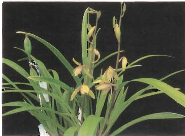
獨 占 鰲 頭

蘭花會一年一度的蘭花大賽及展覽，於三月十日在 Cupertino 市舉行。我們的蘭花專家麥奮近來要悉心照顧妻子療養身體，想難以傾全力赴戰。加上遇到奇寒氣溫，影響開花時間。幸而他的兩盆春蘭「出藝」和「天草」都獲得其中一個項目的第一名和第二名，一盆「小松錦」得第三名。如此佳績，足以自豪。(甄碧桂)