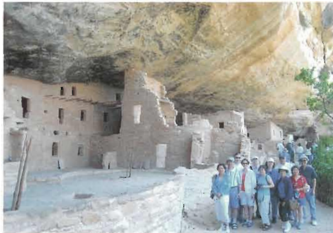
懸崖古城 Mesa Verde

26日：亞、新、可、猶四州交會點是全美獨一無二，在這塊一分為四的圓銅牌上，一人同時可以接觸到美國四個州。測量員和天文學家從1868年就開始尋找這定點，第一個定點標誌是在1912年樹立，我們所見到的圓銅牌定點早已更換多次了。看完四州交會點，我們去看史前懸崖古城 Mesa Verde。約一千多年前已經有古印第安人在此過洞穴生活，因沒有文字記載，那些人的來去情形不太清楚。該地洞