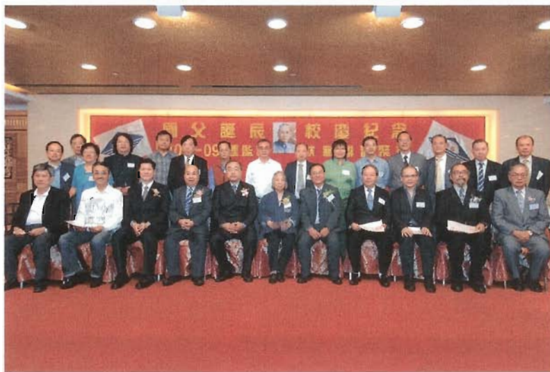
香港德明校友會理監事會與主禮嘉賓