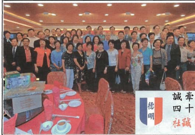
美西德明校友會出版