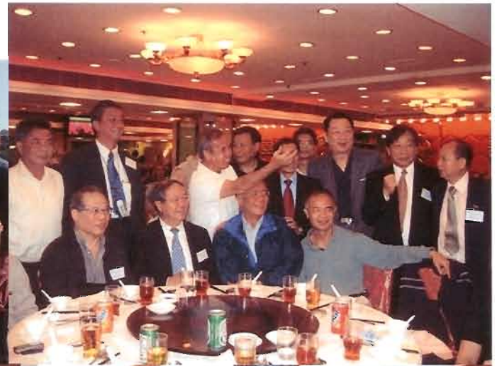
誠牽四十：畢業四十年後的佳芳大合照