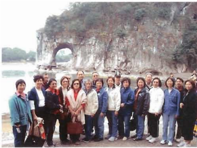
灕江江畔的象鼻山

在經過澳門、珠海、肇慶等景點旅遊後，旅遊車往重點旅遊景點桂林出發。在賀州邊境，看見山的形勢已逐漸由土石山，變成石山。一路上柿樹成林，結果纍纍一片的橙黃色，點綴著蒼藍峻峭秀麗的遠山。加上縷縷霧氣，真是人間仙境。