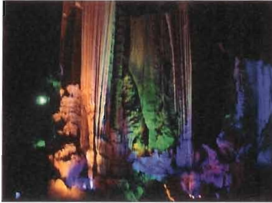
銀子岩內的金銀珠寶

回程時在荔蒲參觀了世界溶洞寶庫-銀子岩。洞中不同形態的鐘乳岩，有的深不可測；有的在洞中水池的倒影下疑真疑假。在女導遊的娓娓道來各名稱的由來及故事，真令人大開眼界。