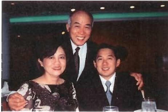
義社伍詠儀亞姐一家樂融融

猶豫不決之際，剛巧有一天小「波士」居然斗膽觸怒亞姐，于是一句「唔玩」，回家作個全職「賢妻良母」。退休人士會又添一員生力軍。 (義67—甄碧秀)