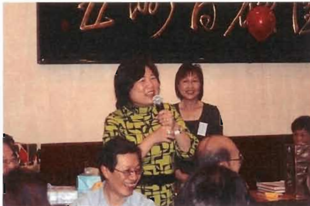
笑話一個比一個的精彩

抽獎和遊戲節目，發揮得精采絕倫。抽中的校友要按照指示作各樣的「天才表演」才可得獎。例如伯英嫂抽中說一個笑話，她一口氣說了三個，使大家笑破肚皮。(又要添食去也)。