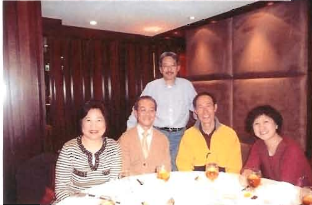
影番張相以作留念