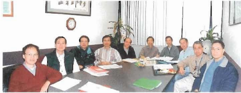
加東校友會籌備會議