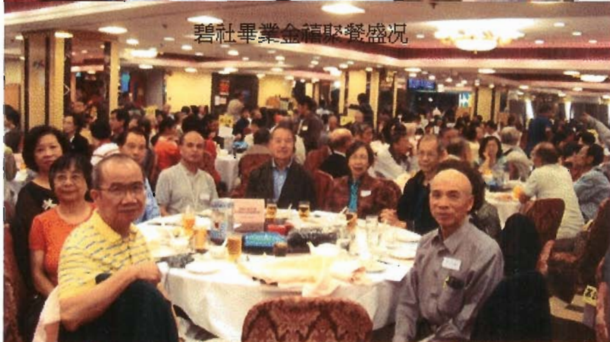
碧社畢業金禧聚餐盛況