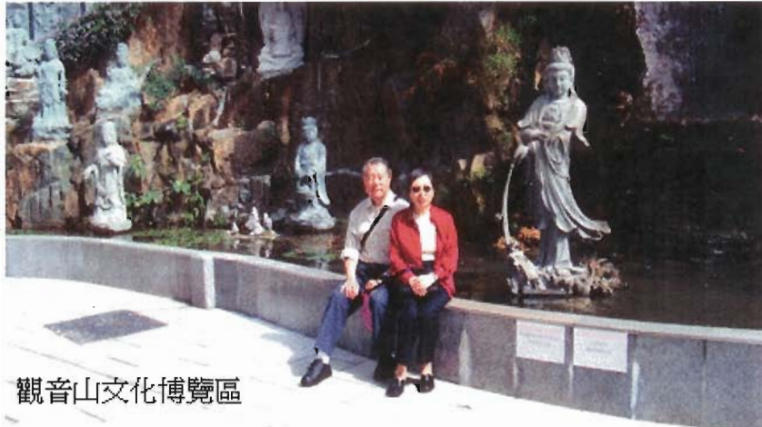
觀音山文化博覽區