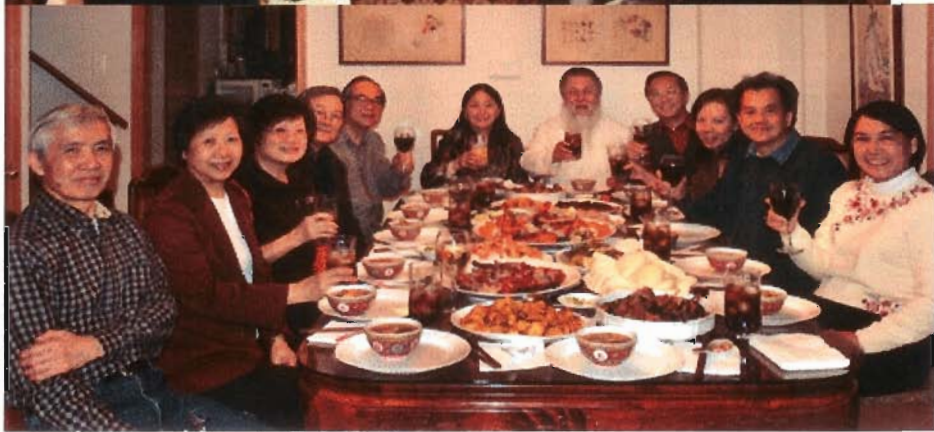
「有朋(仁社湯錦波)自香港來」- 美中校友會