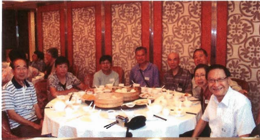
歡迎碧社同學海歸