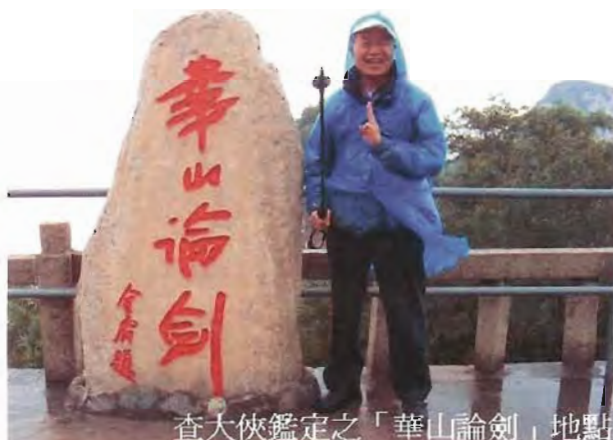
查大俠鑑定之「華山論劍」地點

山可以稱得功德完滿。除五台山外,其他三名山為西嶽華山、中嶽嵩山、及北嶽恆山,東嶽泰山我們曾在06年去過,所以只有南嶽衡山未去