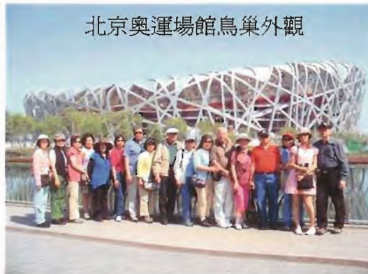
北京奧運場館鳥巢外觀

美食原意是指特色之本地風味,並非預備每餐都要具足豐富之魚肉。旅程指定之特別餐有西安餃子宴、北方麵食三絕、開封宋朝御宴、五台素齋、承德風味、北京烤鴨。其中“宋朝御宴”最