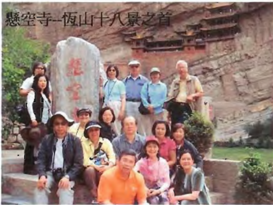
懸空寺--恆山十八景之首