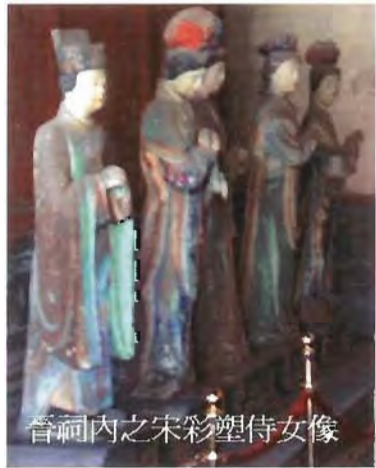
晉祠內之宋彩塑侍女像