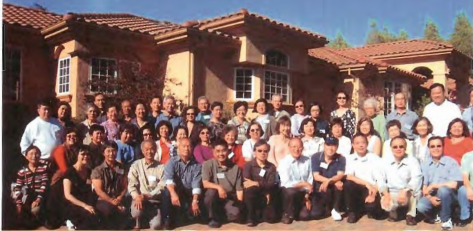
雀林高手過招先來個大合照