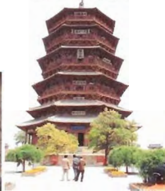
應縣木塔--佛宮寺釋迦塔

(1066年),是中國現存最高最古的一座木構塔式建築物。懸空寺是國內現存的唯一儒佛道三教合一的獨特寺廟,建在懸崖峭壁間,始建於北魏,現已有一千四百