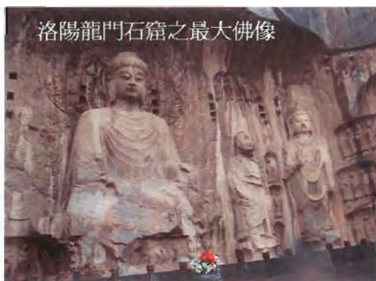
洛陽龍門石窟之最大佛像

古蹟文化在這次旅程中甚為眾多,稱之為考古之旅也不為過。事實上,我們在大同遇到一隊由加大退休教授領隊之考古團,正和我們行程相同只方向相反。我們共經古都五個:西安(古長安)、洛陽、開封、大同、北京。世界文化遺