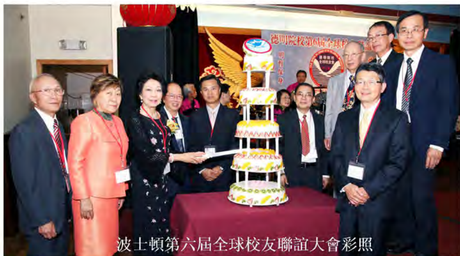
波士頓第六屆全球校友聯誼大會彩照