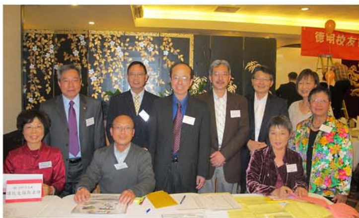
美西校友會北加新春聯歡