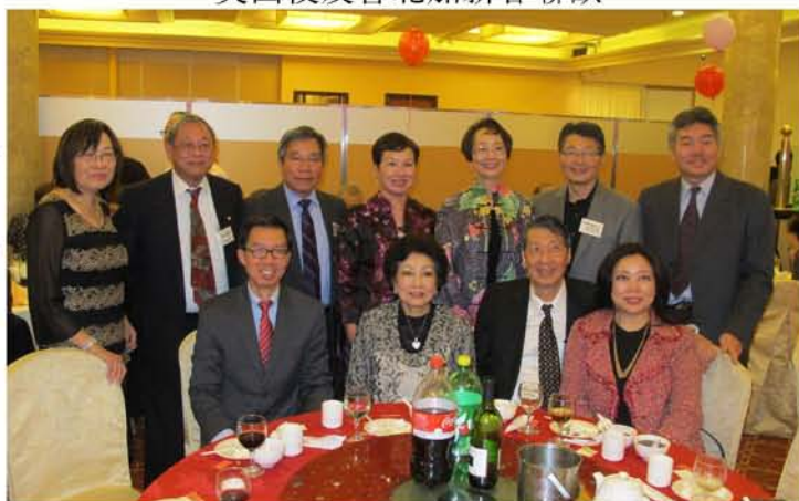
美西校友會南加新春聯歡