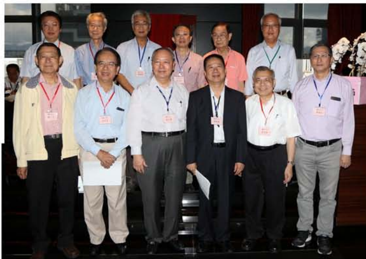
香港德明(臺灣)校友會成立典禮