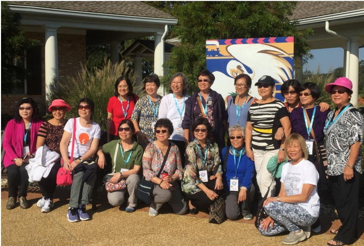
芝加哥聯誼大會之七日遊