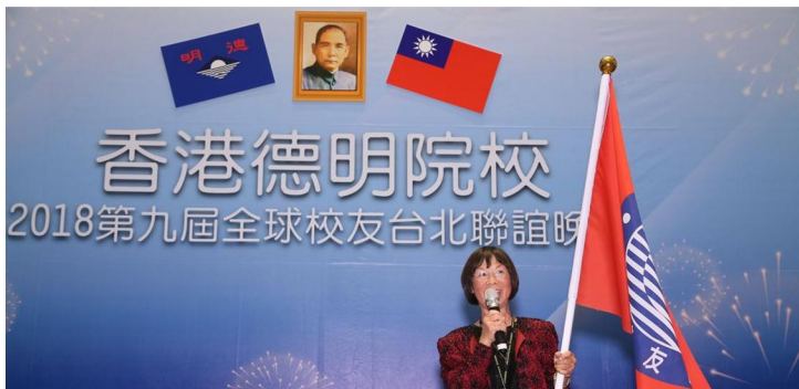
美西接辦第十屆全球校友聯誼會