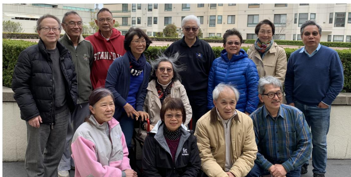
全球校友聯誼大會籌備委員會成員