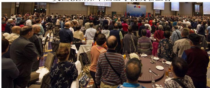
第九屆全球校友聯誼大會盛況