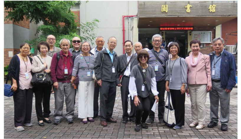
參觀德明科技大學