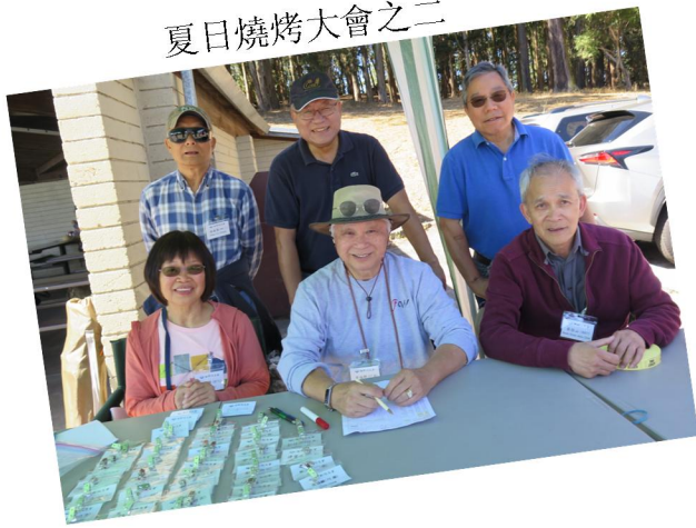
夏日燒烤大會之二