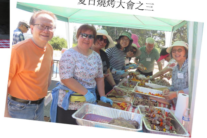
夏日燒烤大會之三