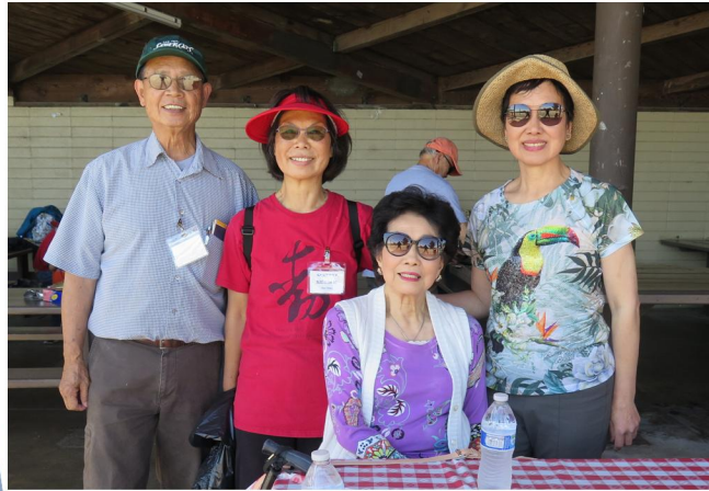
夏日燒烤大會之一