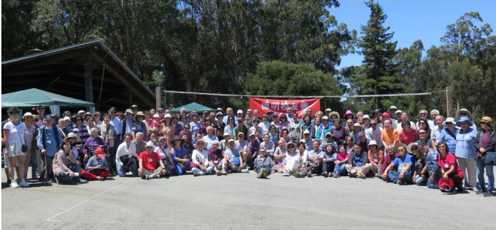
北加州校友會夏日燒烤