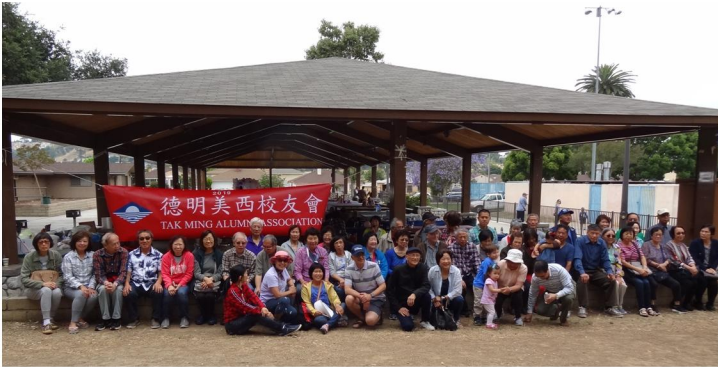
南加州校友夏日郊遊